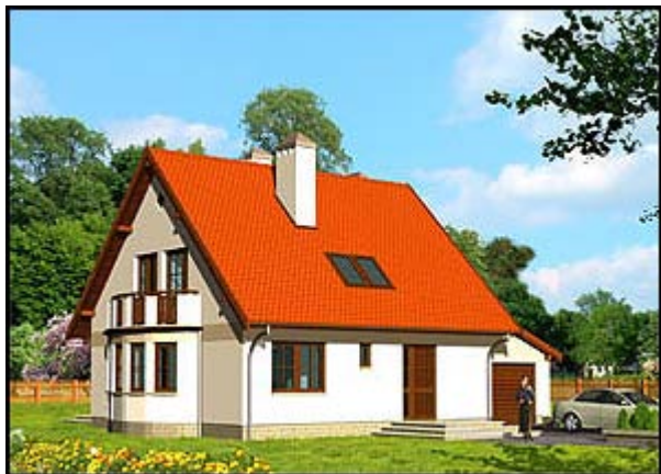
budynki mieszkalne, zabudowa rozproszona